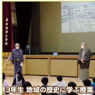
3年生 地域の歴史に学ぶ授業