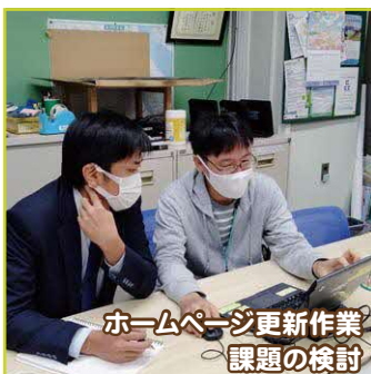
ホームページ更新作業 課題の検討