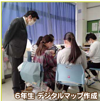
6年生 デジタルマップ作成