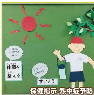
保健掲示 熱中症予防 すいどう