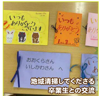
地域清掃して下さる 卒業生との交流