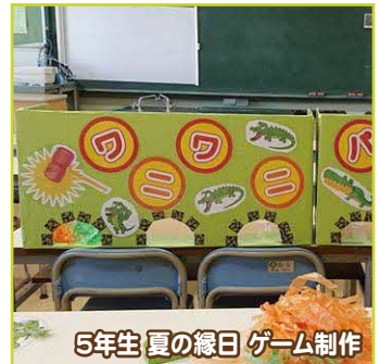
5年生 夏の縁日 ゲーム制作