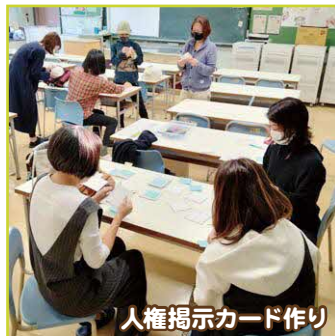
人権掲示カード作り