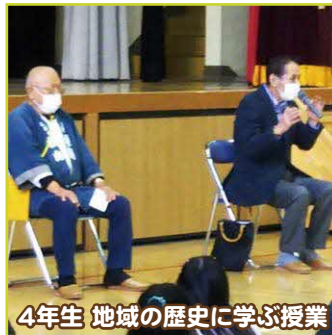
4年生 地域の歴史に学ぶ授業