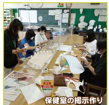
保健室の掲示作り