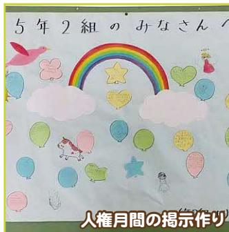
5年2組のみなさんへ 人権月間の掲示作り