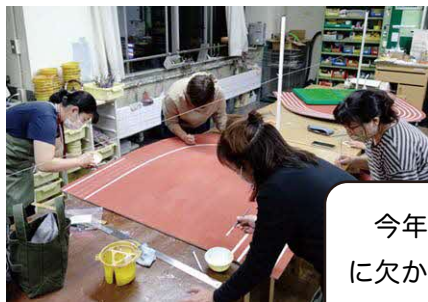
展示の準備 終了後の搬出 など