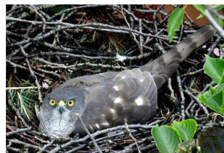
旗台小にツミが営巣しました