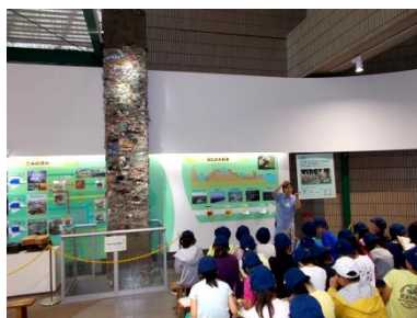
中央防波堤埋立処分場