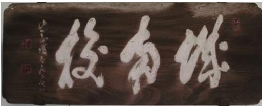
明治15年・山岡鉄舟揮毫の校名額