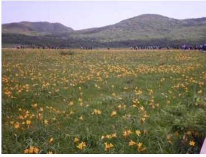
雄国沼湿原のニッコウキスゲ群生