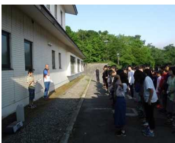
司会の生徒も大活躍