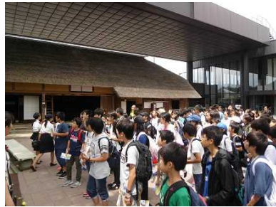
野口英世記念館にて