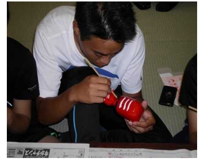
生徒には負けないぞ！