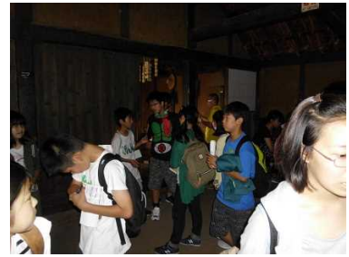
野口英世記念館にて (生家内)