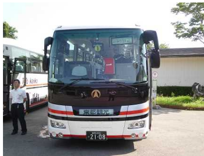
お世話になった観光バス