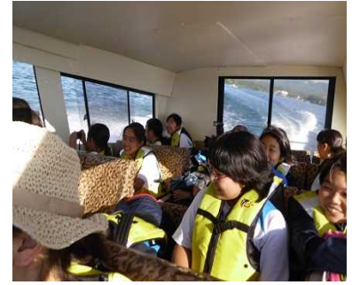
檜原湖のモーターボートクルーズ