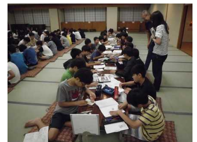
1 泊目、家に郵送する絵手紙書き