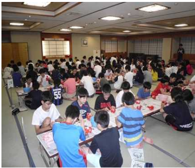
赤べこ絵付け体験