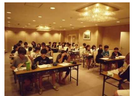
班長・室長等会議