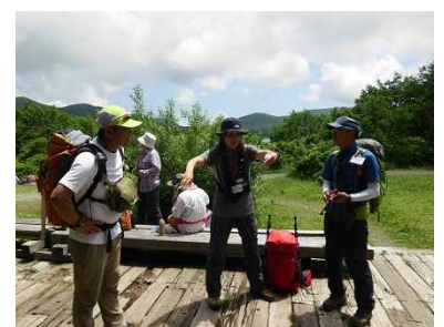
昼食後のガイドさんミーティング