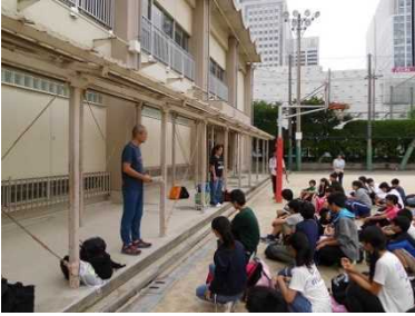
出発前の集合風景

台風一過、晴れやかな裏磐梯方面での移動教室に行ってきました。 その一端を紹介いたします。