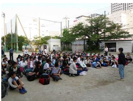
「ただいま」、解散式の様子

3日間、雨の降られず、全ての行程が実施でき、まさに、最高の状態の移動教室でした。