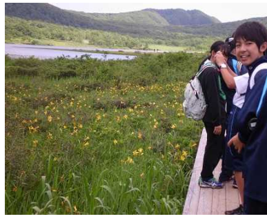
雄国沼とニッコウキスゲを満喫