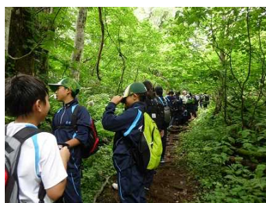
さあ！これから登山だ！