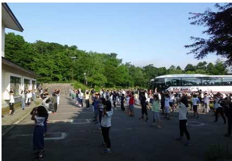
最終日の朝のラジオ体操