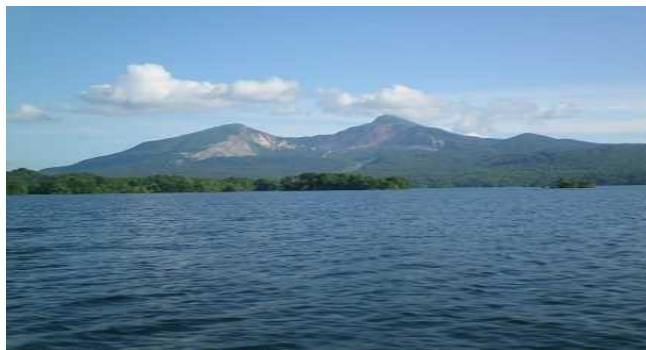
檜原湖から見た裏磐梯山 (噴火の傷跡)