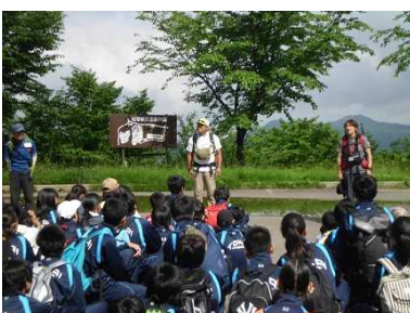
雄国山ガイドさん紹介