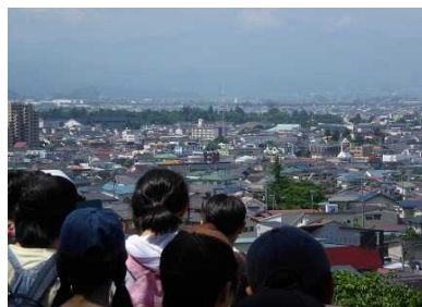
飯盛山から白虎隊に思いを馳せて