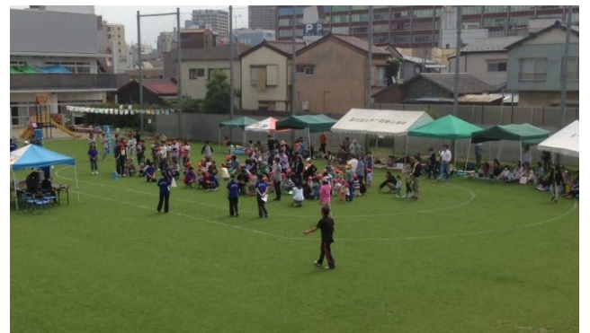
すこやか園 乳児 運動会 5月25日

はげて土が見えた所を補修するための苗です。 作ったポット苗を持ち帰って、おうちで芝生を育ててみませんか？