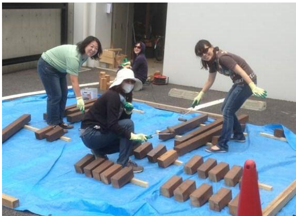
ウッドデッキ作り、始めました。