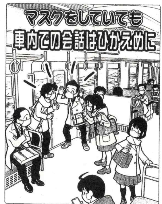
左...左前側の男性の髪が手前側の男性の髪に付く。右...右前側の男性の髪が手前側の男性の髪に付く。マスクをしていても車内での会話はおかえめに