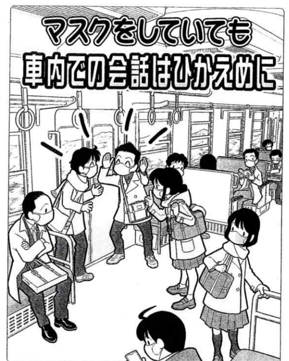
左: 左手前の男性のかげり、騒いでいる男子生徒(左)のマスク、手前の男性の髪の手、注意している女子生徒のマスク、右手前の男子生徒の髪の手、奥の男性が見ている(隣人)のもの